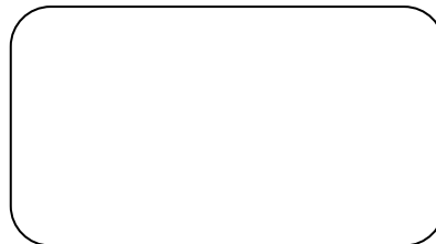
Stempel des Unternehmens

_____ Datum/ Unterschrift Praktikumsbetrieb